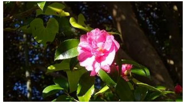
サザンカが綺麗に咲いていた