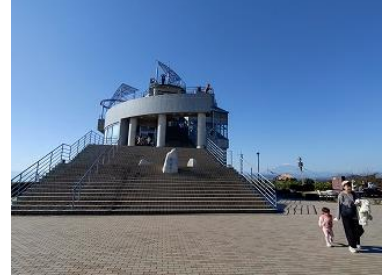
鉄塔が見えてきて、湘南平に到着