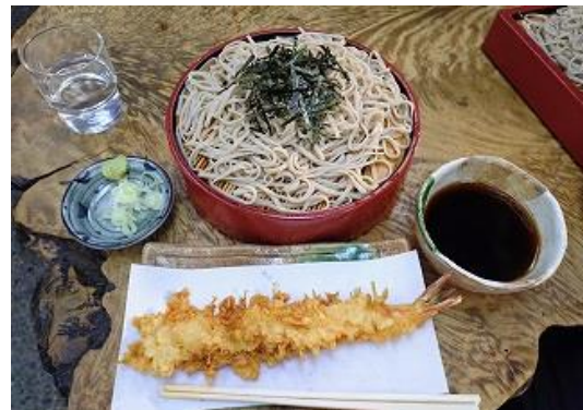
天ぷらそば、エビが大きい！