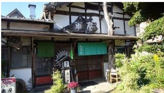
高来神社と大磯駅の間に在るソバ屋 12:45