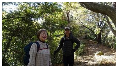
適度なアップダウンの道