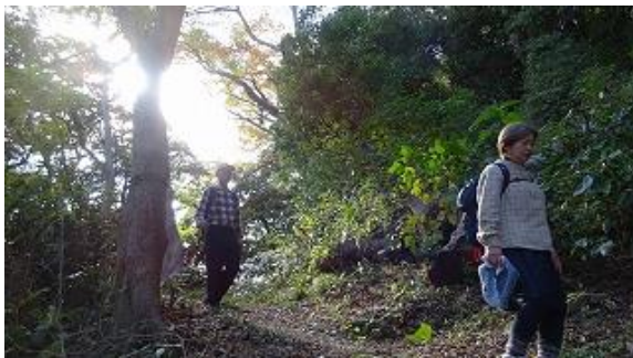
高麗山からの下り