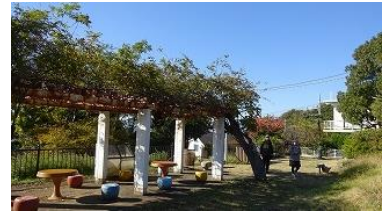
登り切った所が高田公園