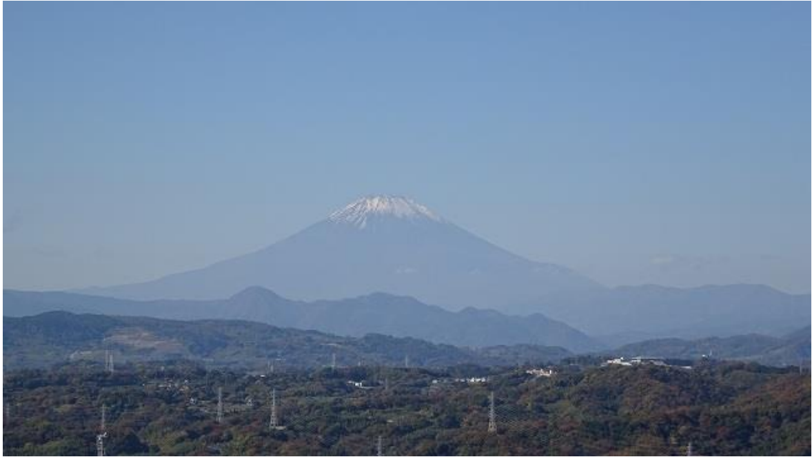
天気が良かったので富士山が見えた、