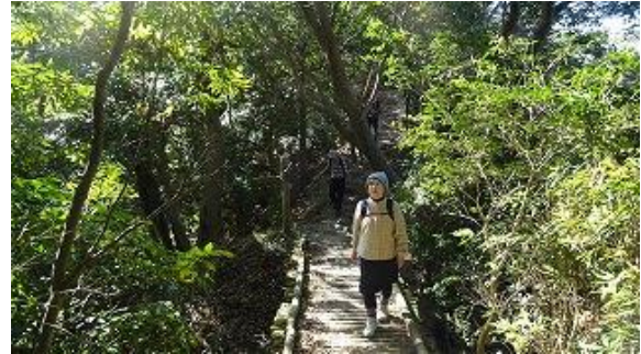
途中に有る木の橋を渡る