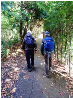
高田公園から山道