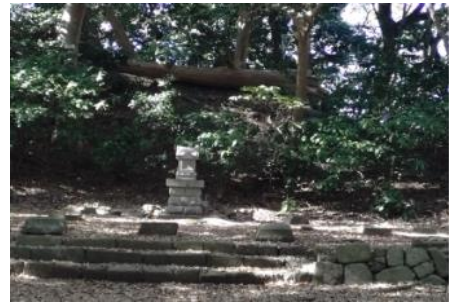
高麗山に在る高来神社跡地