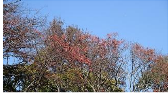
紅葉は少し木の頂上付近