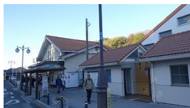
大磯駅集合 9 : 30