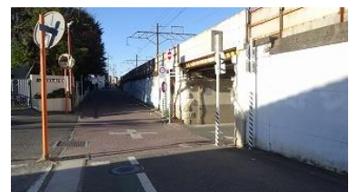
東海道線の下を右に曲がる