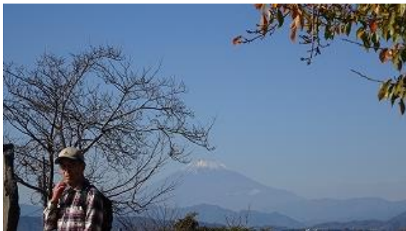
富士山をバックに！