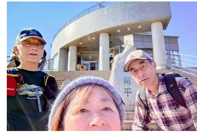
湘南平で記念撮影 10:52