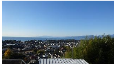
坂道を登ると海が見える