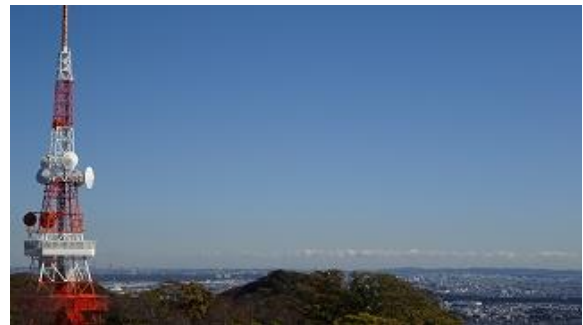
鉄塔の先は、大磯の町、海の向こうは千葉県