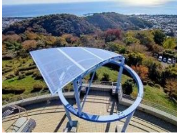
頂上の建物に在るモニュメント、鍵がかかっているが恋人同士の「愛の南京錠」