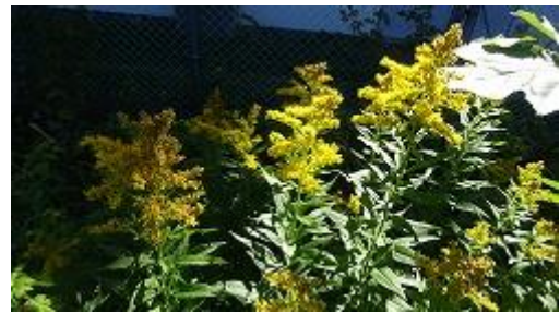
セイタカアワダチソウ？