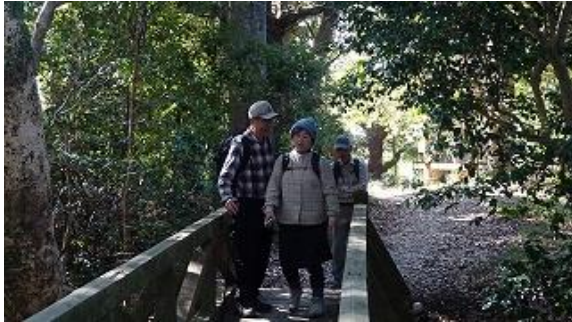
八俣山から高麗山（こまやま）へ