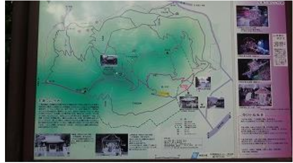
下る途中、高来神社境内に在る地図