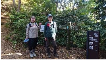
分岐点到着、左、湘南台、右浅間山（鳥居と、小さな祠がある）