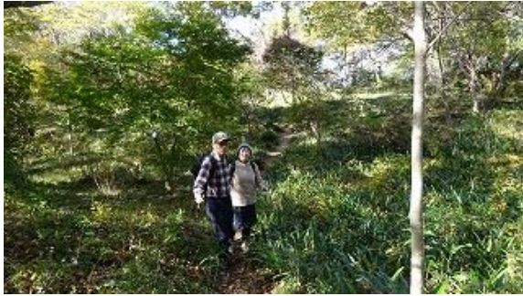
浅間神社から八俣山へ