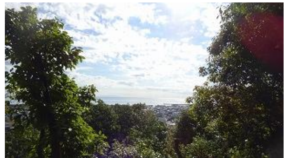
下って来ると海が見える場所に出る