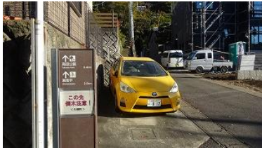
右に曲がる案内版