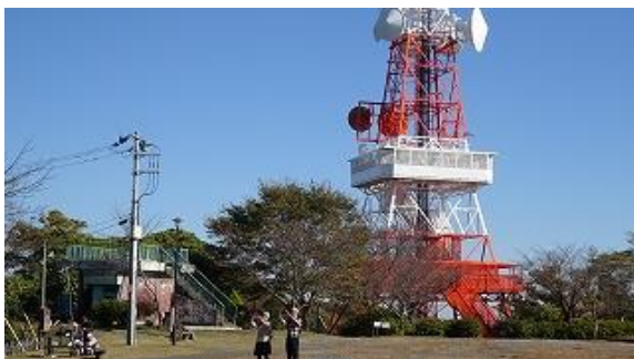
初めて来た二人はそろって富士山撮影？当日は天気に恵まれ快晴で 360 度の展望が楽しめた。