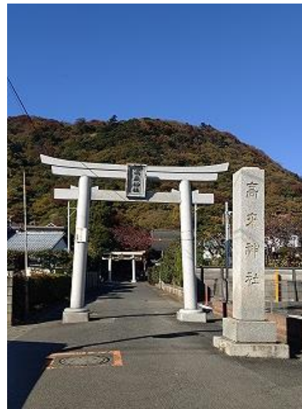
国道 1 号線方向から撮影、高来神社鳥居