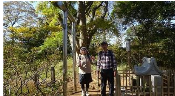
浅間神社鳥居と石の社