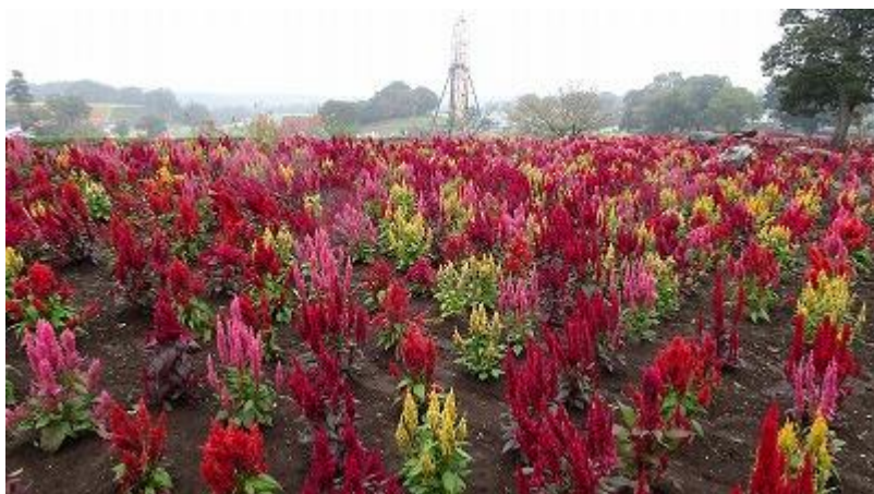
寄せ植えエリア越しの観覧車