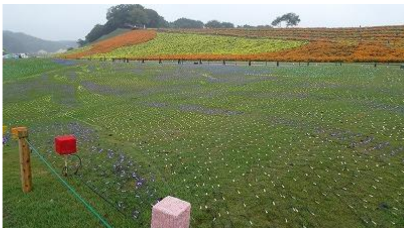
イルミネーションゾーンから見たマリーゴールドの丘。 小雨で薄暗く、イルミネーションが灯されてキラキラ光っている。