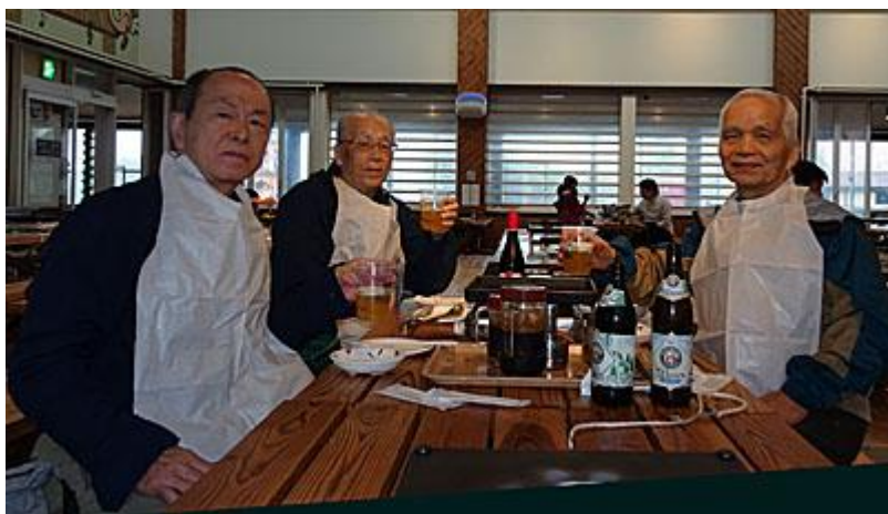
11:54 バーベキューレストラン