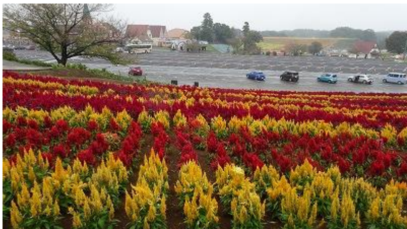
ラインエリア越しのレストラン群（左） あとでバーベキューをやる。