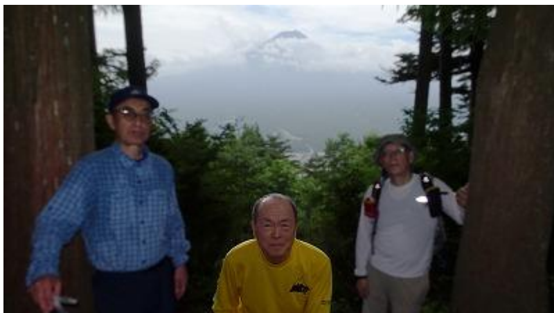
天上山山頂からも富士山は見えていたが、雲がかかってしまった。