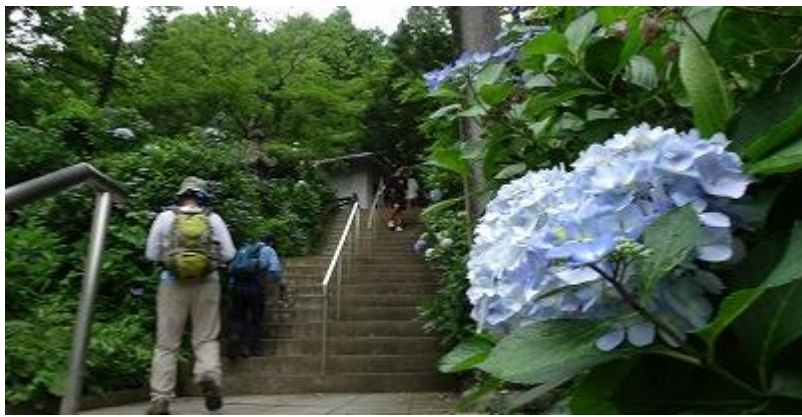
神社の石段脇のあじさい。