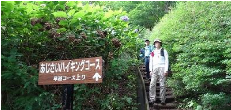
護国神社からハイキングコースへ。 「早道コース上り」を進んだが、こちらではあじさいはあまり見かけなかった。

10:33 ナカバ平展望台。富士山が綺麗に見える。太宰治の石碑があった。「惚れたが 悪いか」と刻まれていた。