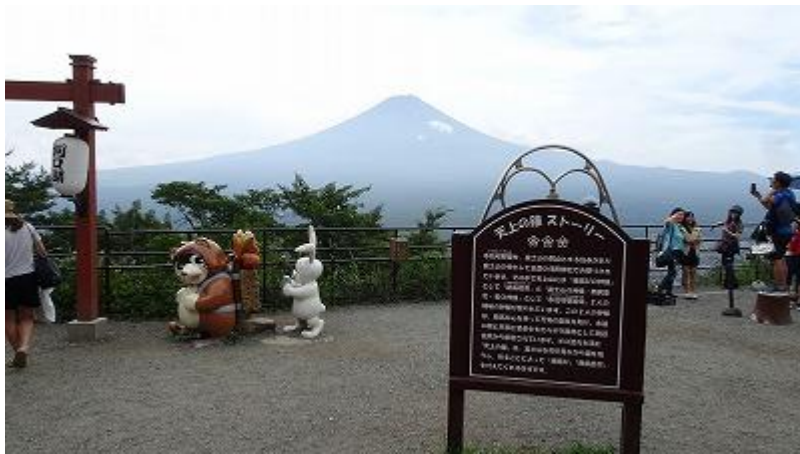
11:08 ロープウェイ山頂駅。