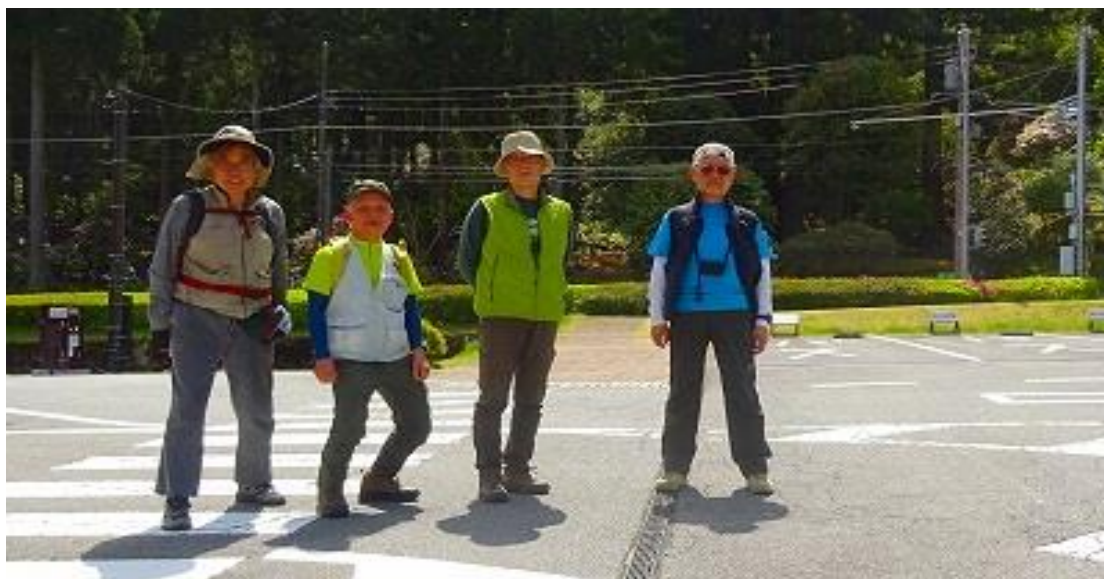
シャクナゲ園をバックに駐車場にて！ 9 : 5 9