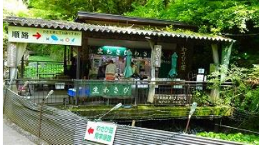
帰り道に在るワサビ販売店