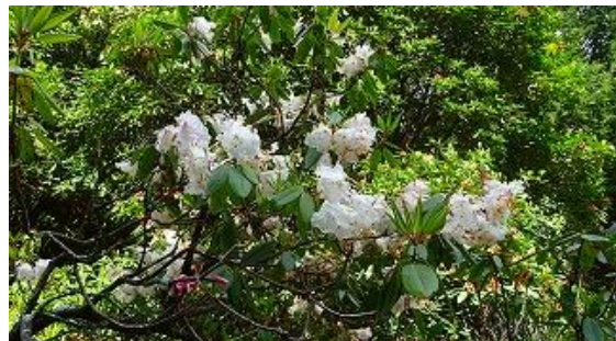
それでも、結構見られた！