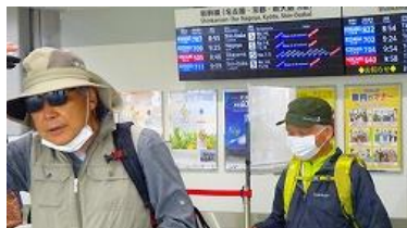
三島駅 8 : 40 集合

行程は、三島駅でレンタカー、一路天城グリーンガーデンを目指す、約 1 時間で到着。