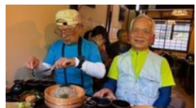
店は繁盛他に営業店少なく