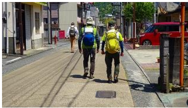
浄蓮の滝見学の後、修善寺見学 12:17