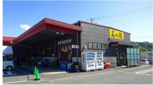
農の駅 農産物直売 14:31