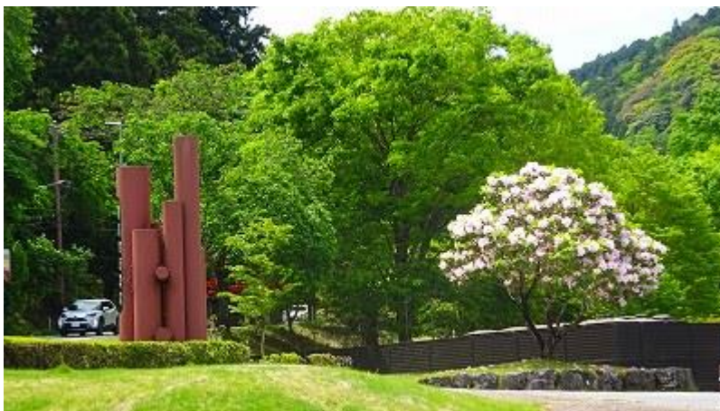
駐車場に1本、綺麗に咲いていた シャクナゲの木