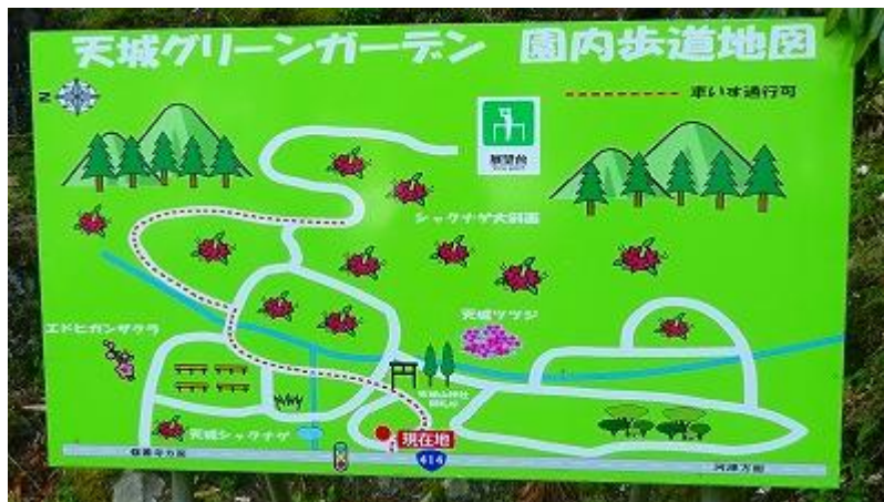
天城グリーンガーデン園内図