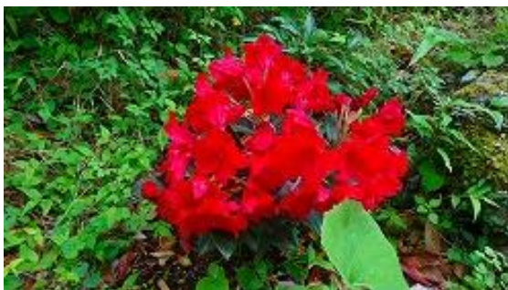
滝へ行く道にあったシャクナゲ