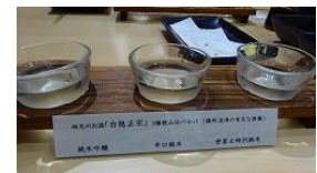
地元の日本酒 3種飲み比べ