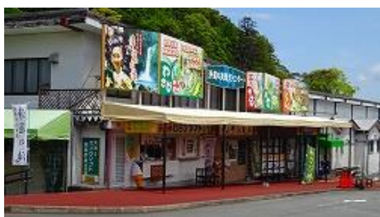
連休後の平日で店はお休み