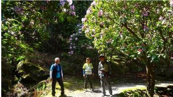
道は舗装されていて、両脇にシャクナゲ