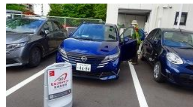
セルフライドゴー