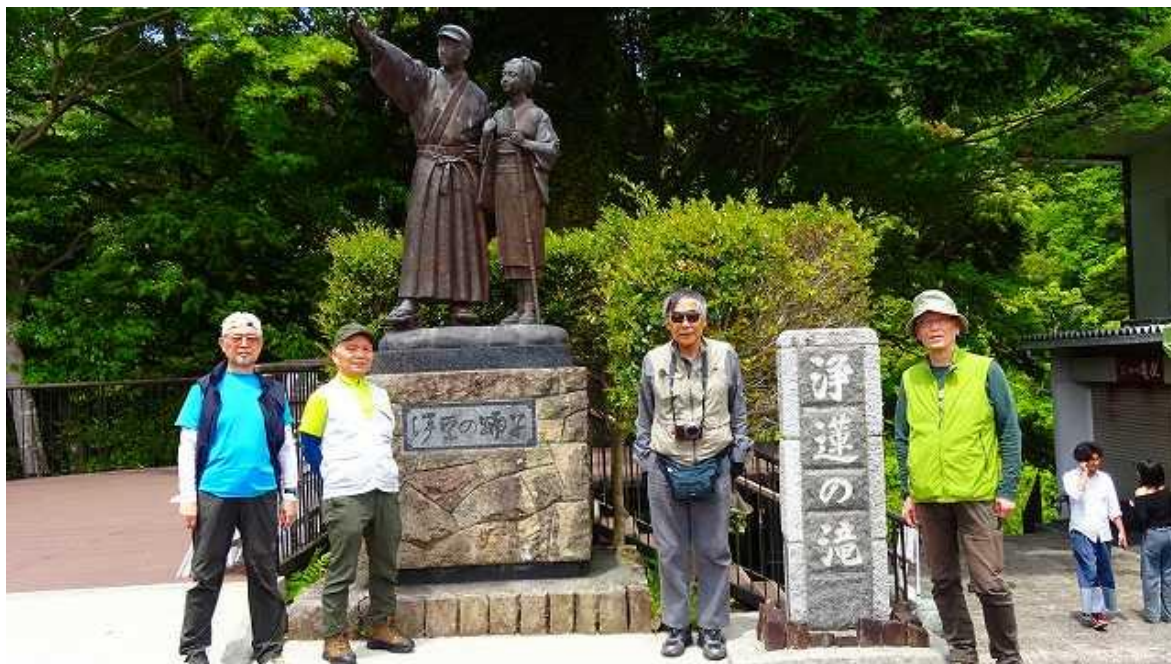
浄蓮の滝入口にある伊豆の踊子の銅像前にて！ 11：03