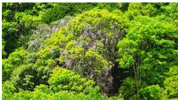
浄蓮の滝に行く途中対岸に咲く、ヤマフジ