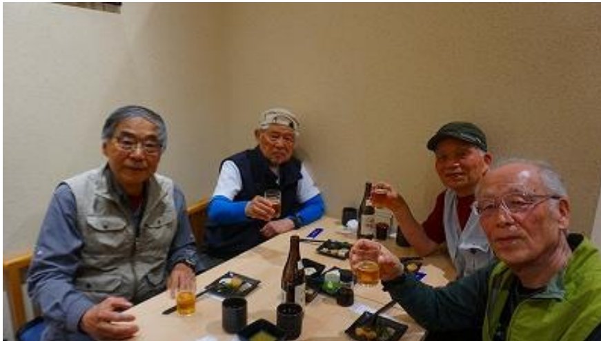
三島駅南口側のソバ屋で打ち上げ 15:54