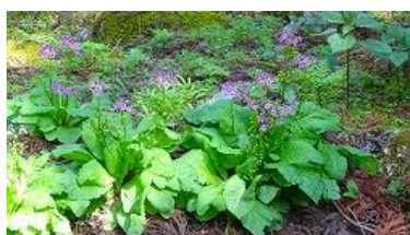
クリンソウ咲いていました