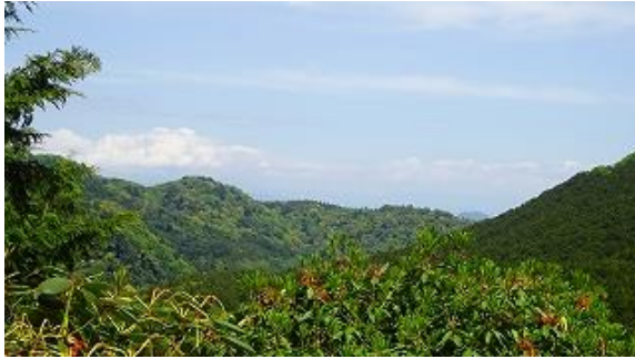
展望台からの景色、残念、富士山見えず