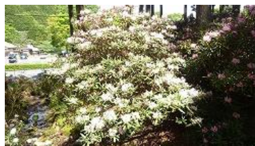
道路を渡りシャクナゲ園へ