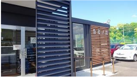
白岩の湯 ¥420 温泉 13:43