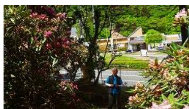
シャクナゲ園から道の駅