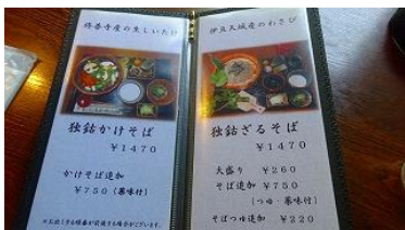
昼食やっと思つたソバ屋