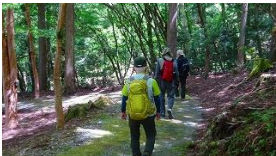
シャクナゲはピークを過ぎていたが！