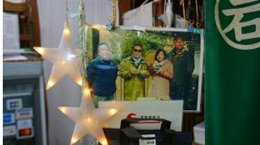
タモリも来たと言う！