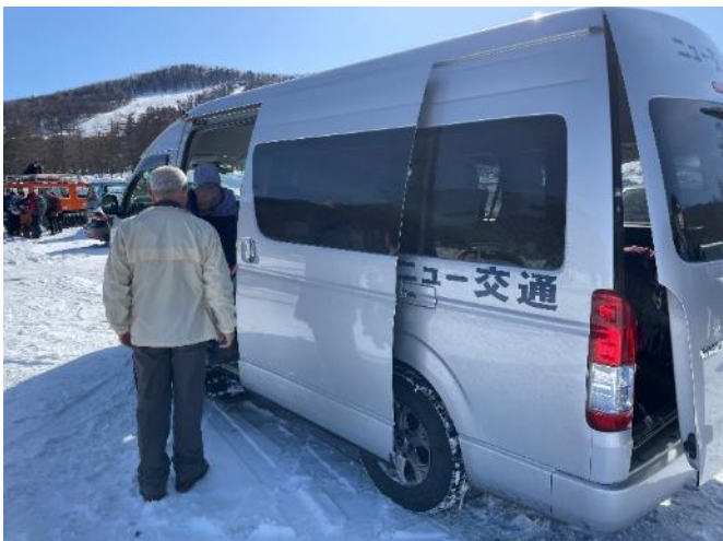
14:00 宿の方が予約してくれたジャンボタクシーで 佐久平駅に向かいます。

高峰マウンテンホテルバス停→佐久平駅までは 約 18,000 円。今回は 5 人だったのでかなり 割高でした(>_<)。