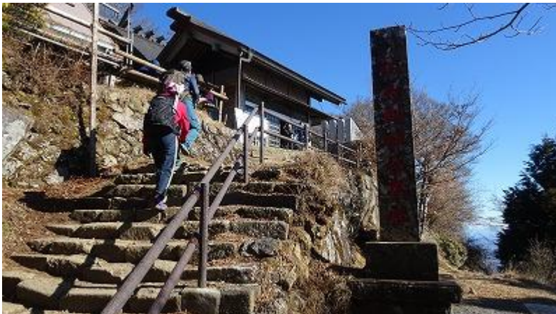
予定より 20 分ほど遅れで 11 時 20 分山頂着。