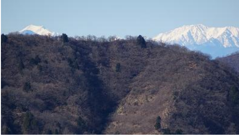
南アルプスも見えている。 左のピークは聖岳 右は赤石岳らしい。(服部さん調べ)