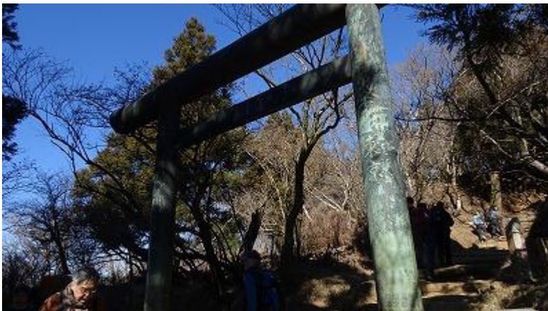
表参道に合流。 ここから山頂はあと少しだ。