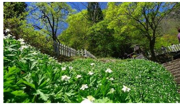
戸隠神社とヒメイチゲ