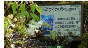
トキワイガリソウ