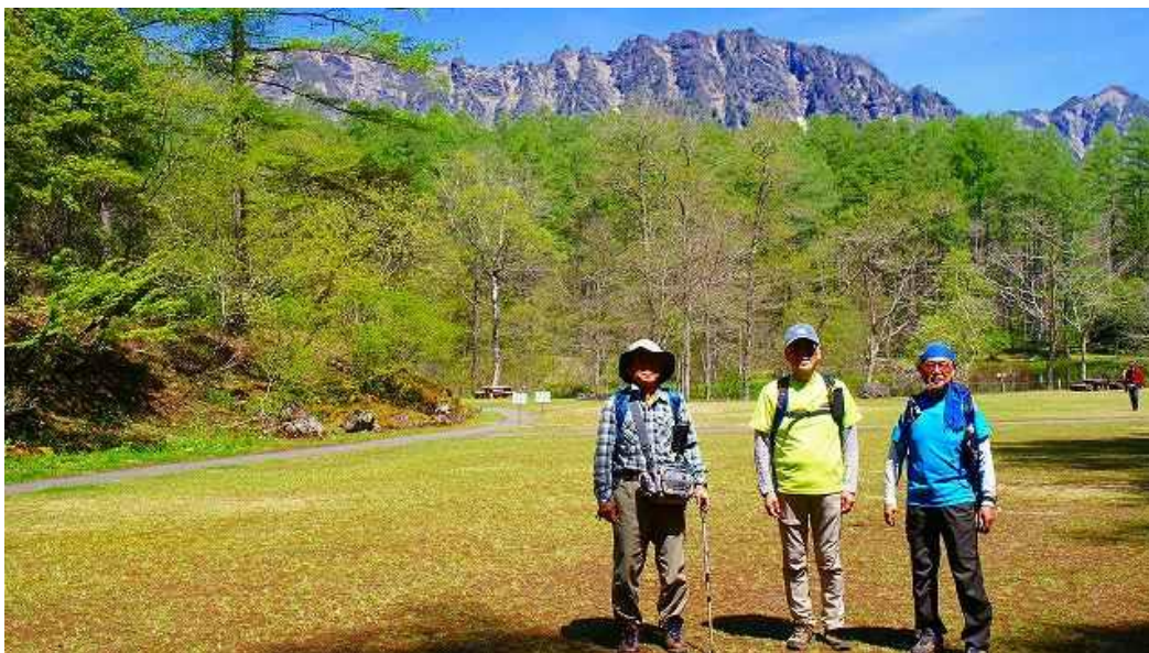
入口を入っただけに見えてきた戸隠山をバックに！ 10:01