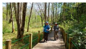
木道で歩きやすい