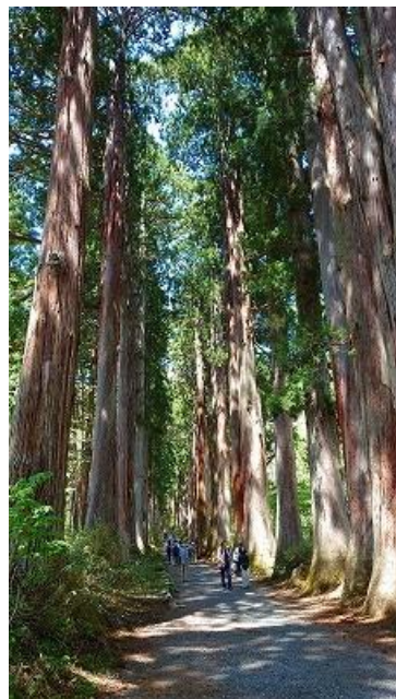
奥社参道の杉並木の巨木