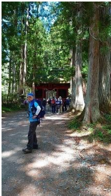
陣神門をバックに