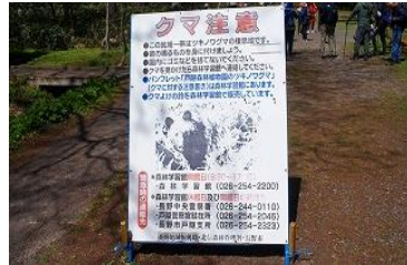
入口に早速注意看板今年は何処もクマ出没！ 9:55