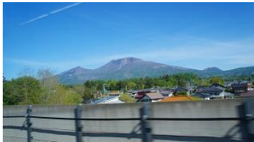
途中浅間山がよく見える、