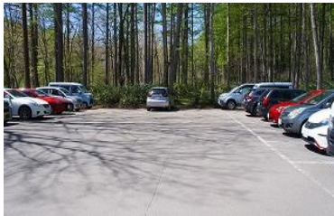
駐車場は既に満杯であったが、通路に駐車