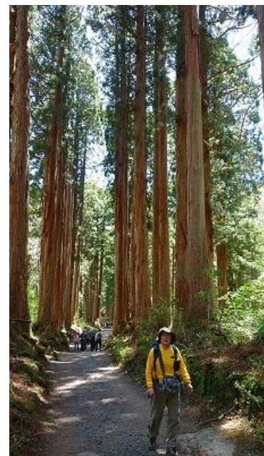
参道の杉の巨木の間を歩く