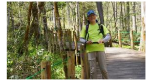
ミズバショウ群生 10:28