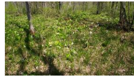
ミズバショウ群生