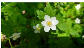
コミヤマカタバミ