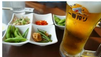
風呂上がりのビールメニュー