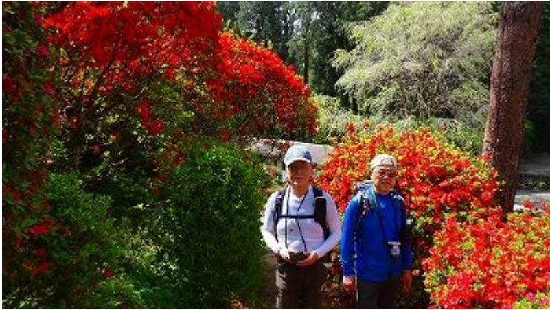
ツツジに囲まれて一枚