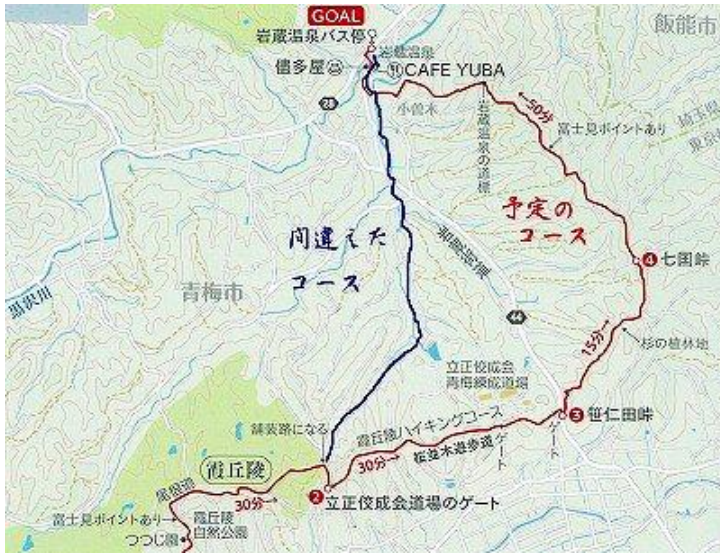
ショートカットしたコース