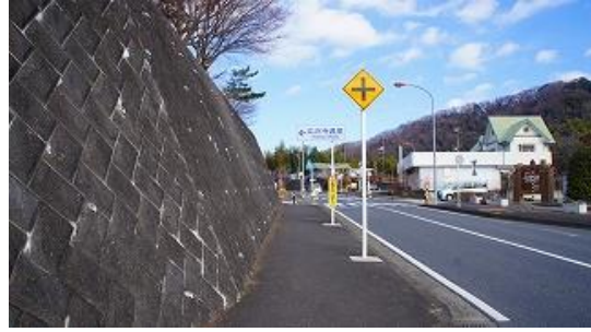
広沢寺温泉入口バス停車 9:32