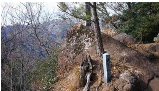
10:43 短い岩場の先に、覗きの松の石碑