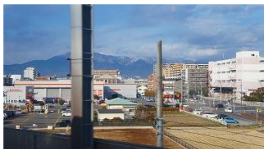
本厚木駅からの景色

登山コースは、地図表記の登り、下りの通り歩いた。下りの実際は、青→を通り、トンネルを通過して広沢寺温泉、玉翠楼経由でバス停に至る。