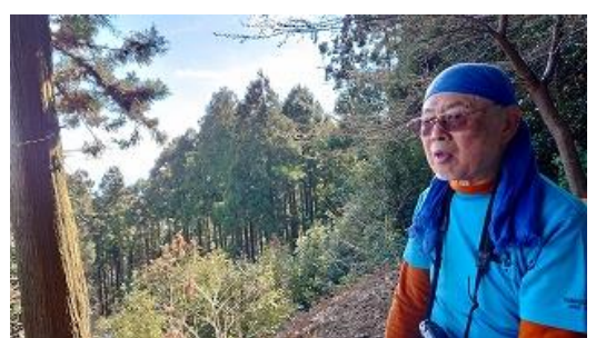
11:26 熊本さん持参の純米酒を戴き、昼食を取る。