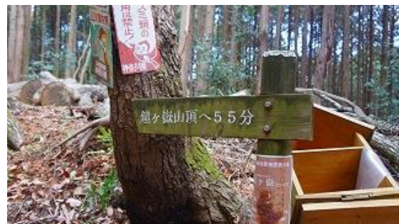
鉄扉から、鐘ヶ嶽 55分と標識