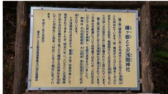
鐘ヶ岳と浅間神社の説明看板 9:42