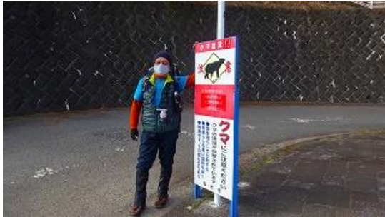
バス停から登山口に向かう途中にクマ注意看板