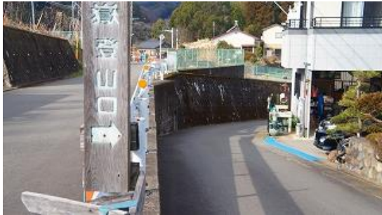
右側に行くようにとある、登山口案内