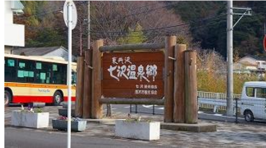
バスの終点は次の停留所七沢温泉 9:33