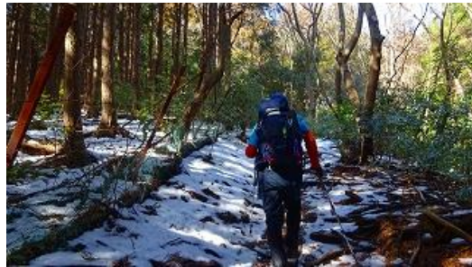
11:45 雪道は頂上付近に有った