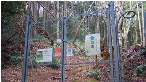
暫く行くと、動物除けの鉄扉が出て来る、9:52