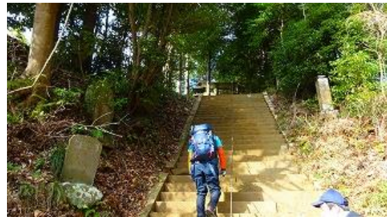
セラピーロードの説明、血圧が減少するとの説明 9:45 登山口は浅間神社への階段から登る