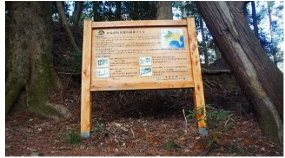
9:52, 28丁目迄在る丁石の, 初めの1丁目の石, ほぼ100mおきに在る、中間点の水源の森看板