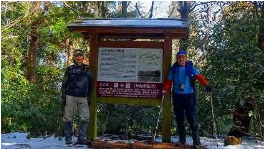
11:42 頂上の説明版の前で！