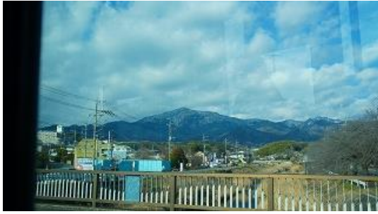
バス乗車中に見えている鐘ヶ嶽