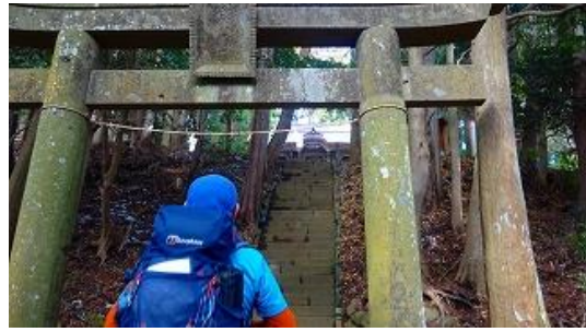
11:06 浅間神社に続く長い階段が出て来る 319 段スタート、神社が見えてきた、鳥居にて右の石碑は 28 丁目の丁石