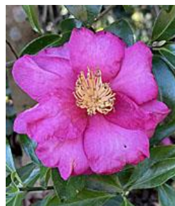
椿 or 山茶花