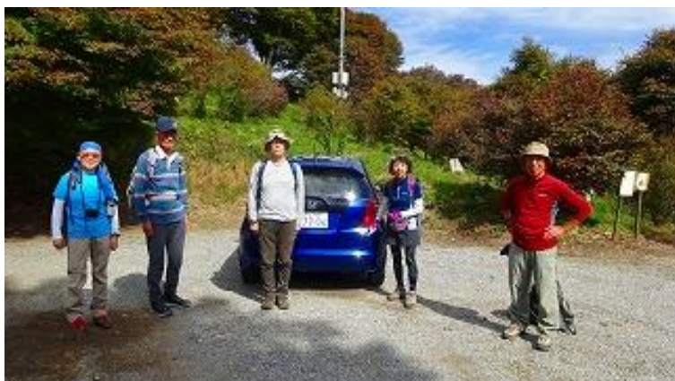
駐車場で記念撮影