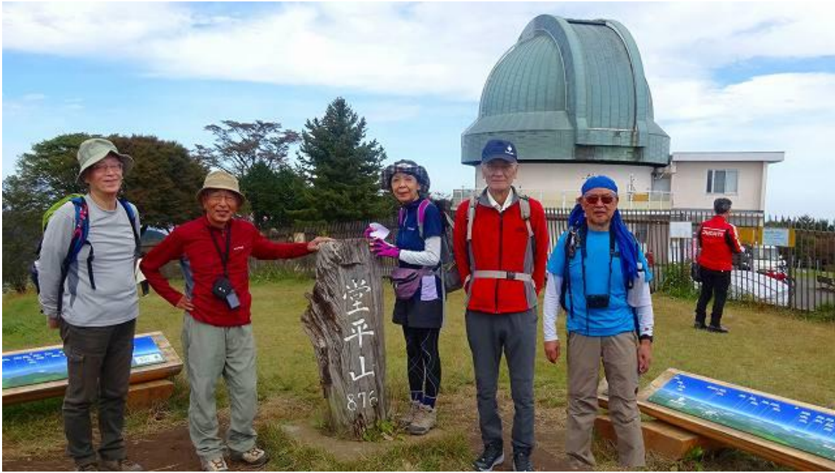
堂平山、山頂で昼食を取る。