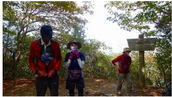
笠山頂上でしばし滞在