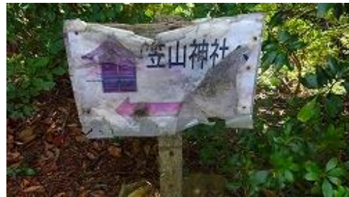
少し奥に行くと笠山神社があるが！パス