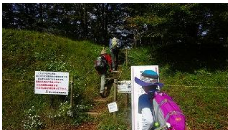
登り始めて、地元のおばさんに会う、堂平山は反対ですよ！と！

この場所は、剣が峰駐車場ではなく、堂平山近くのキャンプ場の駐車場。歩き出してすぐに道を間違える。右が正解だが、左に行く。