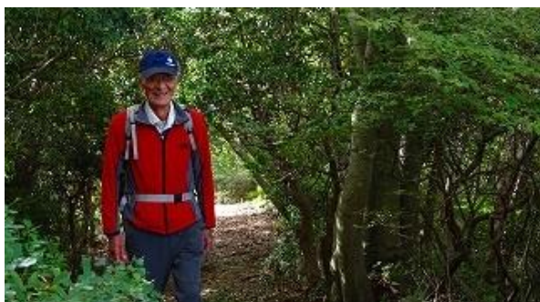
笠山の頂上が見えた！