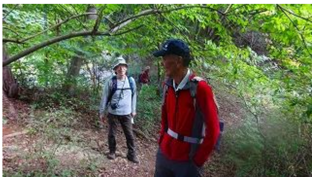
山道に入ると、笠山峠の看板があり、その方向に行く！