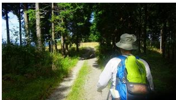
天文台が見える道まで帰ってきました。