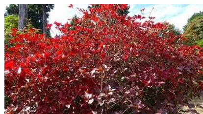
駐車場で見た紅葉樹