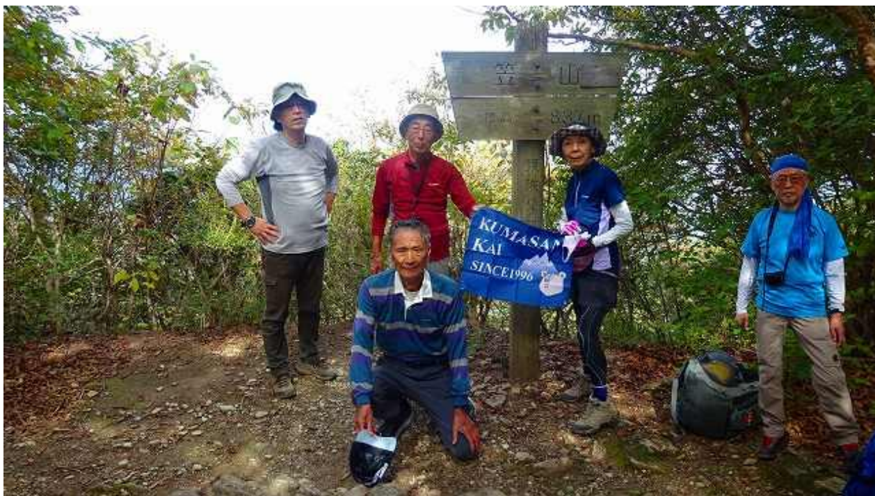
笠山頂上の看板前で記念撮影