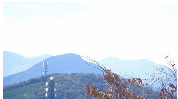
武甲山、奥左には雲取山がかすかに