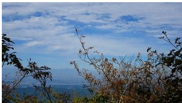
頂上からの眺望、西側が開けている