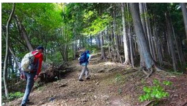
笠山の登り口は急登である。

笠山峠の標識が無いまま、山道を下ると、林道に出る、笠山と笠山峠の立派な道標に行き当たる、堀さん、この道標に従い、さっさと笠山方向？歩くが、下りになり、戻ってくる。よく見るとマジックで笠山とある