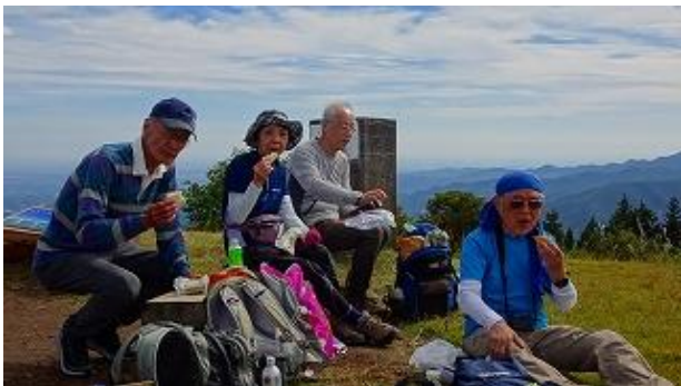
眺望の良い場所で昼食