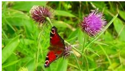
アザミとクジャク蝶