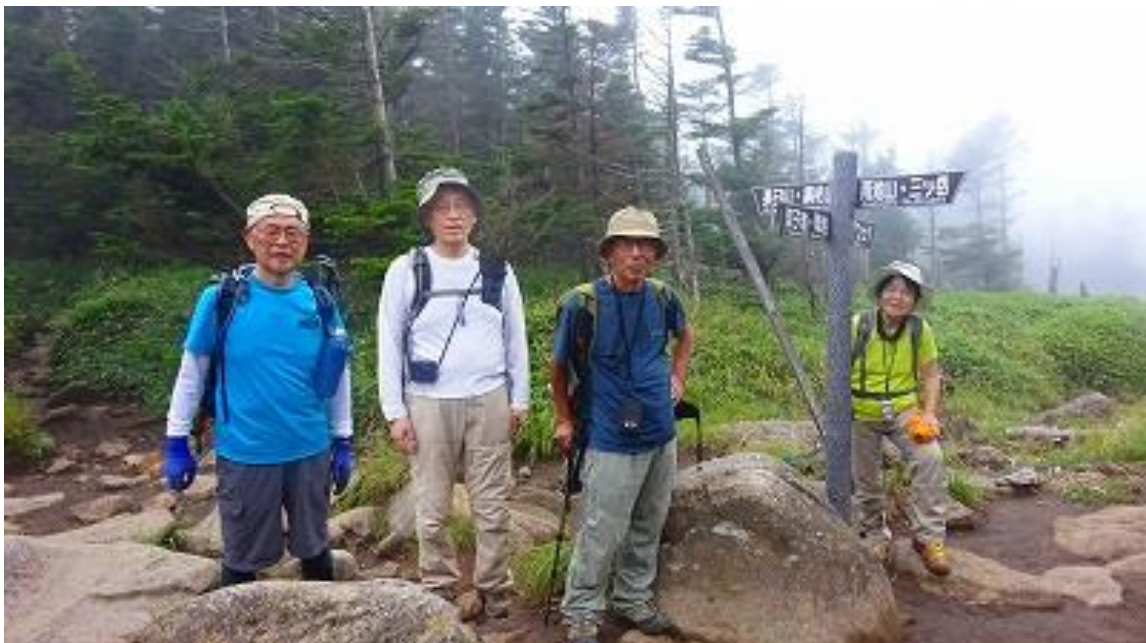
分岐の所で記念撮影 11:55