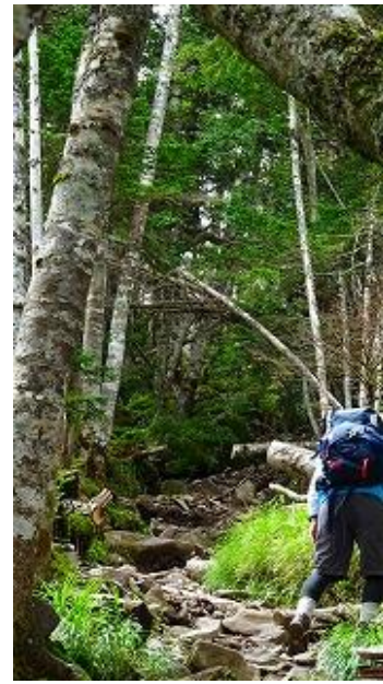
トップは、御年 82 歳の熊本さん、早い、3 人は置いて行かれる。11:00