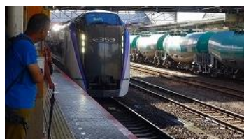
八王子駅あずさ1号

茅野駅からレンタカーで北八ロープウェイ山麓駅に10:00、山頂駅には10:10到着