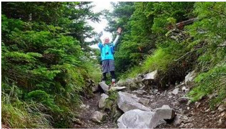
はい！ここが、縞枯山頂上です！1 番に到着。11:13