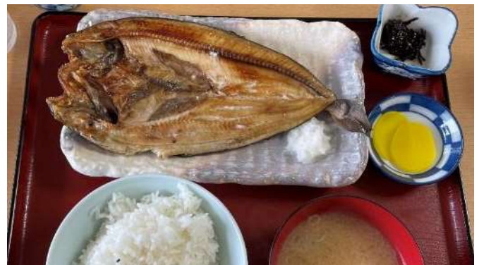
3人は、ほっけの焼き魚定食

ここで、中島ぼやき。。島ぐるめの「ほっけちゃんちゃん焼き」が食べてみたかった。でてきたのは、ほっけ焼きです。 こちら脂がのって美味しかったけど、、やっぱりウニ丼を食べればよかったなあ～。 本日の時価のお値段は、ミニウニ丼 2800 円、ウニ丼 5800 円。なんだか色々後悔となりました。(^-^;