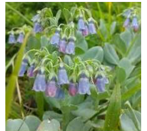
ハマベンケイソウ