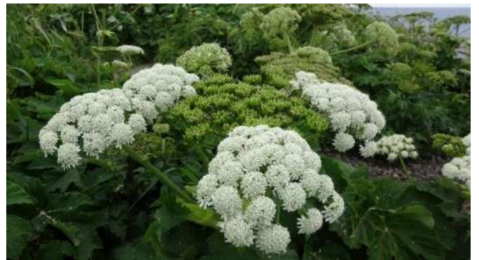
エゾノヨロイグサ？