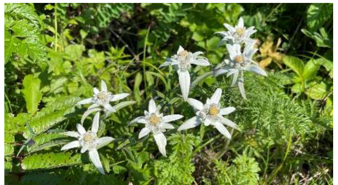
レブンウスユキソウ