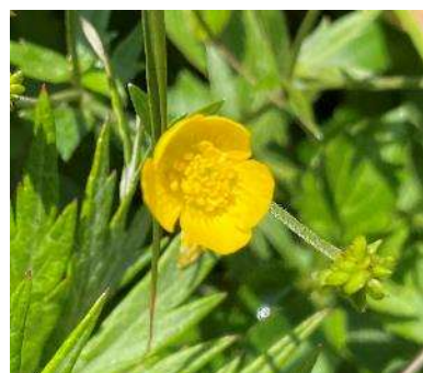
レブンキンバイソウ