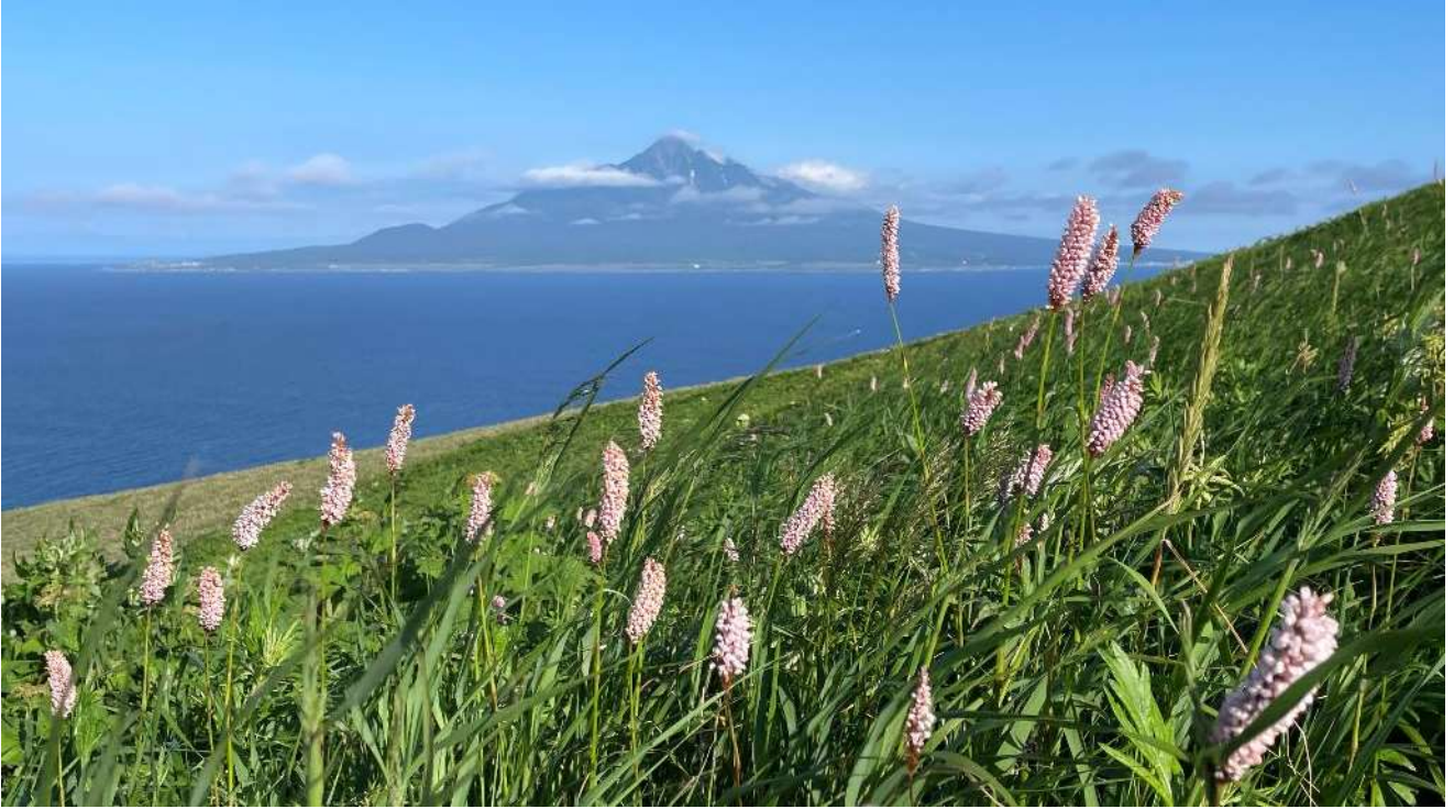
お花は「イブキトラノオ」が満開です。