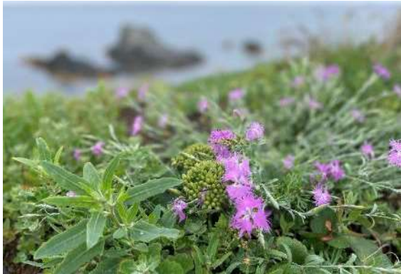
エゾカワラナデシコ