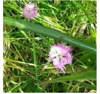
エゾカワラナデシコ