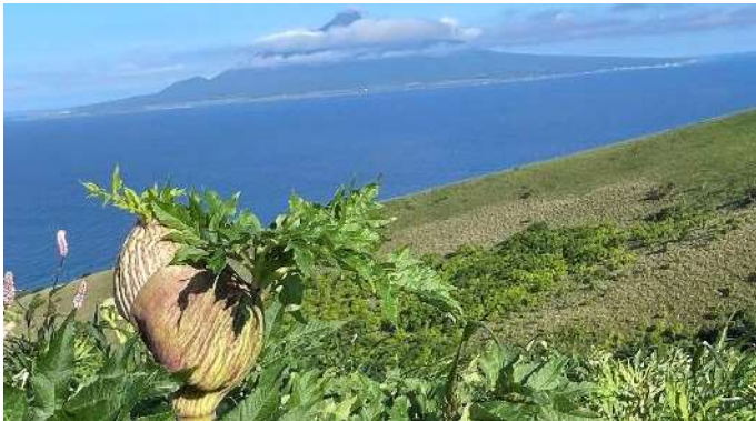
オオサカモチ がかい！