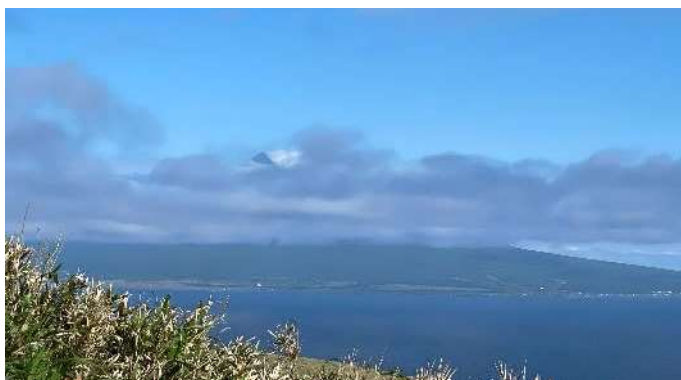
利尻島 利尻富士がちょっとづつ見えてきました！