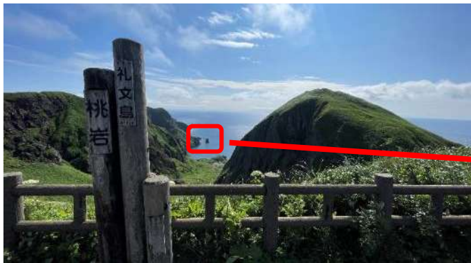
猫岩 背中を丸めて座っている猫が、 海を眺めているように見える奇岩。