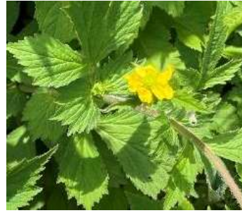
レブキンバイソウ