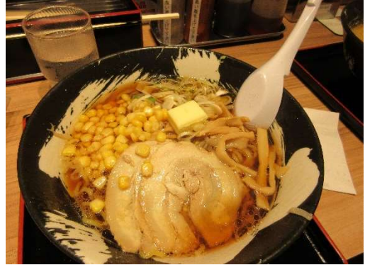
バターコーンラーメン