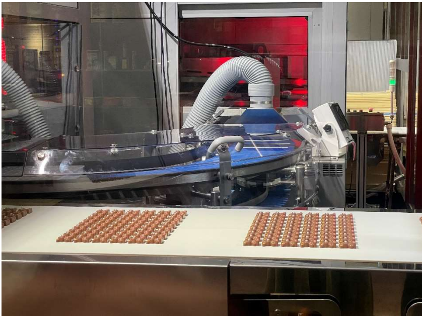
チョコレート工場の 展示コーナーもありました。