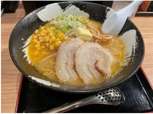
雪あかり バターコーンラーメン