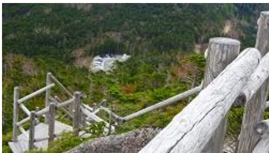
下り、では夢の庭園から駐車場を望む 12:51