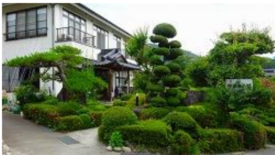
帰りに天然温泉、はやぶさ温泉に寄る 14:15