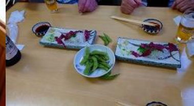
レンタカーを返してから、駅前の居酒屋で馬刺しをつまみに乾杯 15:26