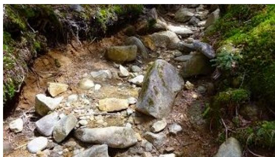
登山道は石ゴロゴロ 10:32