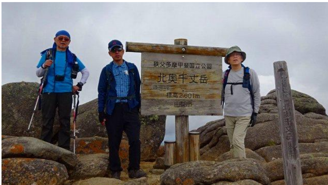
昼食後、北奥千丈岳を經由し下る、最高地点 2601m、12:12