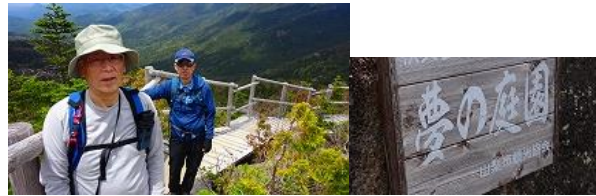
夢の庭園はシャクナゲが群生していた、咲いたら見事な景色になる？