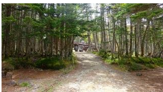
登山道を入ると見える大弛小屋 10:27