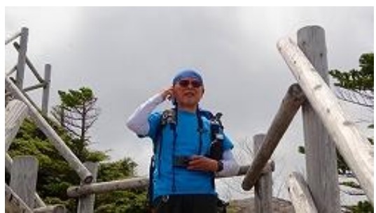
夢の庭園からも周りの山々が眺望できる