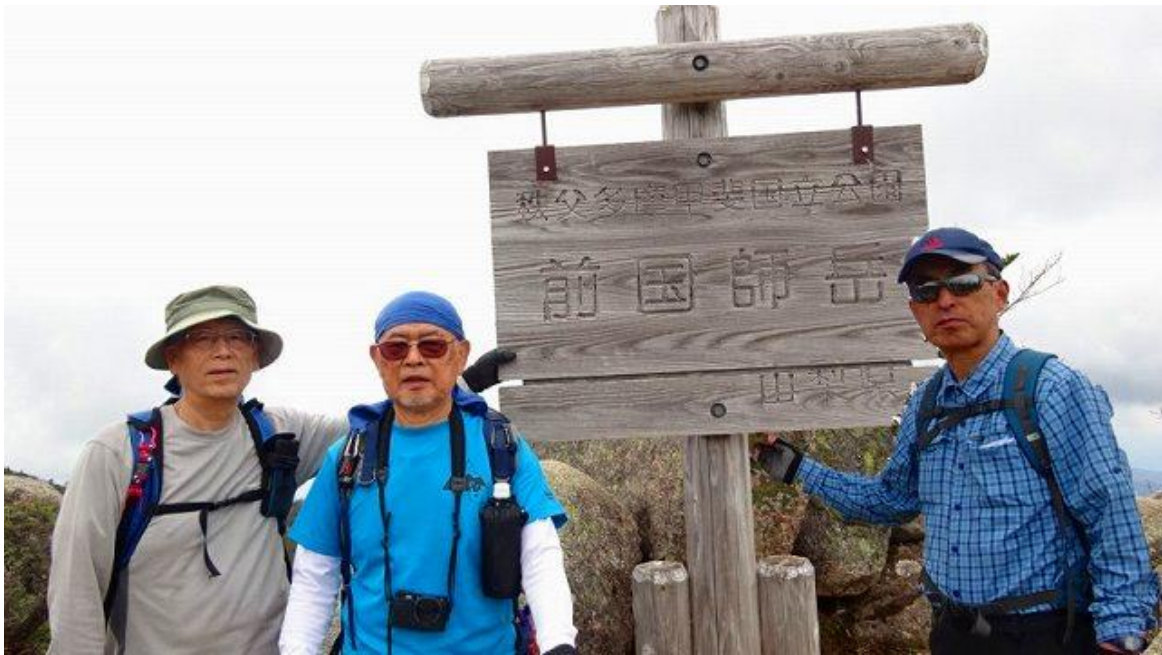
前国師岳、標識前で記念撮影 11:23