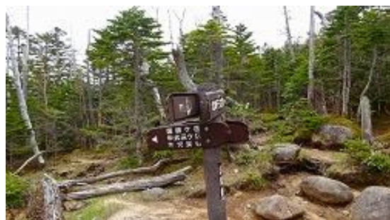
コース上にはシャクナゲが至る所にあった 三繋平分岐、右へ北奥千丈岳、左へ国師岳、11:28