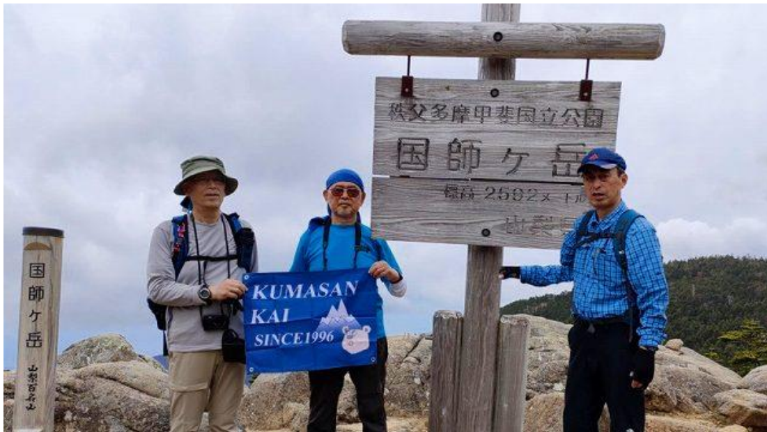
国師ヶ岳到着、記念撮影、11:39