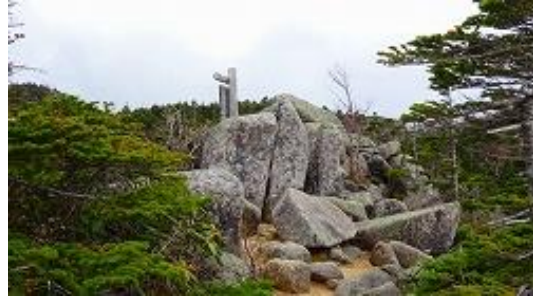
前国師岳が見えた！