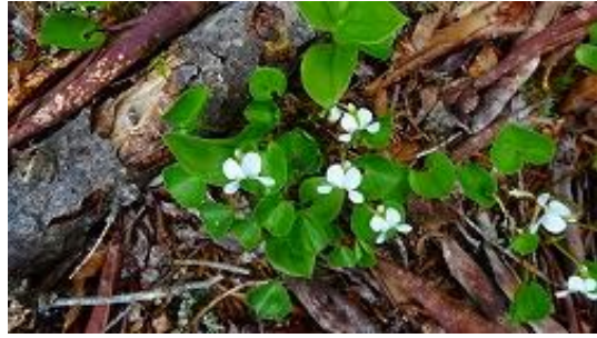
花はまだ早く、唯一確認できた花