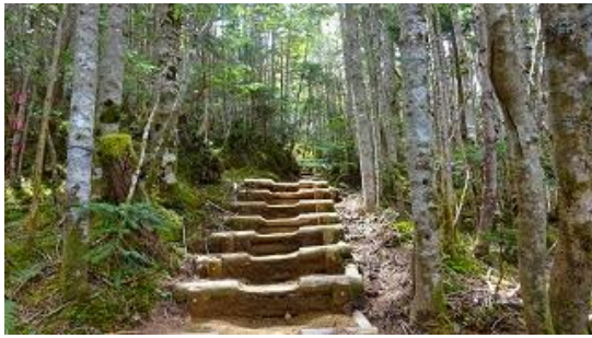
工程の 1/3 ぐらいが木道階段である 10:33