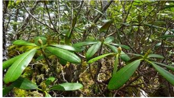
シャクナゲ咲いていない！ 早すぎた！