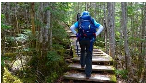
ひたすら木道の階段を上る 10:53