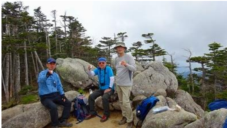
昼食を取る、熊本 さん、持参のワイ ンで乾杯