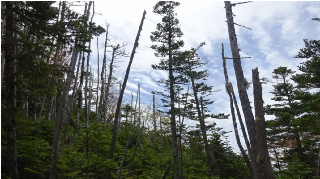
コース上からの景色