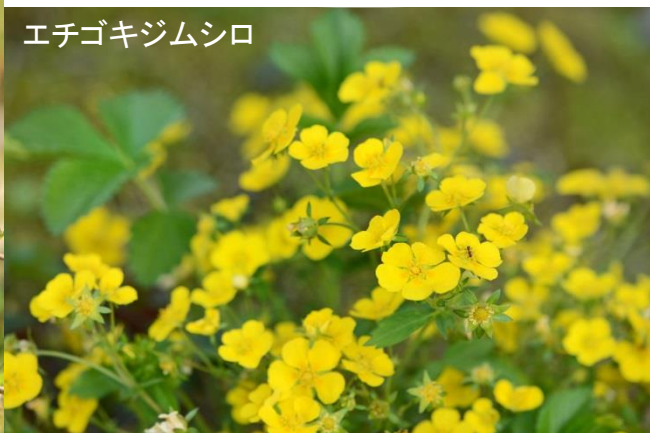
エチゴキジムシロ